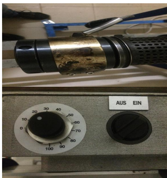
Figure 2-3 : Résistance chauffante (haut), réglage vitesse (bas gauche) et marche arrêt bas droite